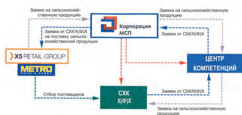
Рис. 9. Схема взаимодействия при поставках сельхозпродукции в федеральные торговые сети

Особенно актуальной для МФХ стала проблема сбыта продукции в условиях пандемии коронавируса. Организация продажи произведенной продукции напрямую без перекупщиков позволяет повысить доходность субъектов МСП. АО «Корпорация «МСП» предложен и отработывается механизм сотрудничества с федеральными торговыми сетями (рис. 9).