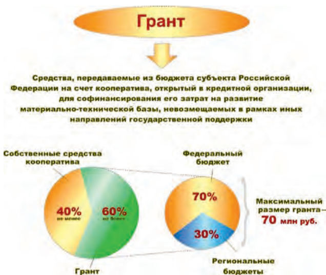
Рис. 4. Схема грантовой поддержки сельскохозяйственных потребительских кооперативов

Недостатком механизма поддержки СПоК являлось то, что гранты на развитие материально-технической базы предоставлялись не всем видам кооперативов, а лишь перерабатывающим, сбытовым и обслуживающим, а сельскохозяйственные снабженческие потребительские и кооперативы других направлений не получали господдержку, хотя потребность в них МФХ достаточно велика.