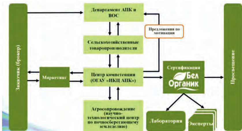
Рис. 8. Схема производства органической пищевой продукции

Курирующим органом реализации региональной программы развития потребительской кооперации является Департамент АПК и воспроизводства окружающей среды Белгородской области [41].