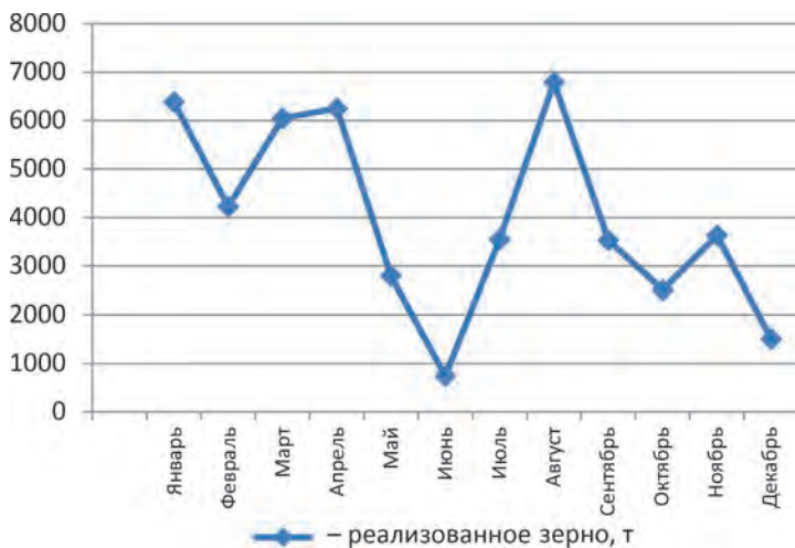
Рис. 2. Сезонные колебания объема продаж зерна по месяцам в СПСК «Союз» в 2018 г.

Вся система взаиморасчетов и взаимоотношений между кооперативом и К(Ф)Х – членами кооператива разработана и отражена во внутреннем регламенте, который после утверждения общим собранием членов СПСК принимает силу закона и неукоснительно выполняется всеми участниками кооперативного формирования. В СПСК «Союз» прием продукции от членов кооператива осуществляется на основании договора по передаче продукции для ее продажи в кооператив, который заключается исполнительской дирекцией СПСК и сельхозтоваропроизводителем ежегодно до 15 июня. До начала уборки исполнительная дирекция доводит до сведения сельхозтоваропроизводителей информацию, необходимую для нормальной организации в кооперативе приема продукции на период уборки: график работы и приема зерна, нормы и нормативы, требования к качеству продукции, предполагаемые цены и другие сведения. На каждую привезенную партию поставщику выдается реестр о приемке, подписанный представителем кооператива (заведующим лабораторией, а в его отсутствие – лаборантом, являющимися материально-ответственными лицами) и сельхозтоваропроизводителем. В этом ре-