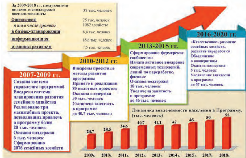
Рис. 6. Этапы и результаты реализации программы «Семейные фермы Белгородья»[ 40]