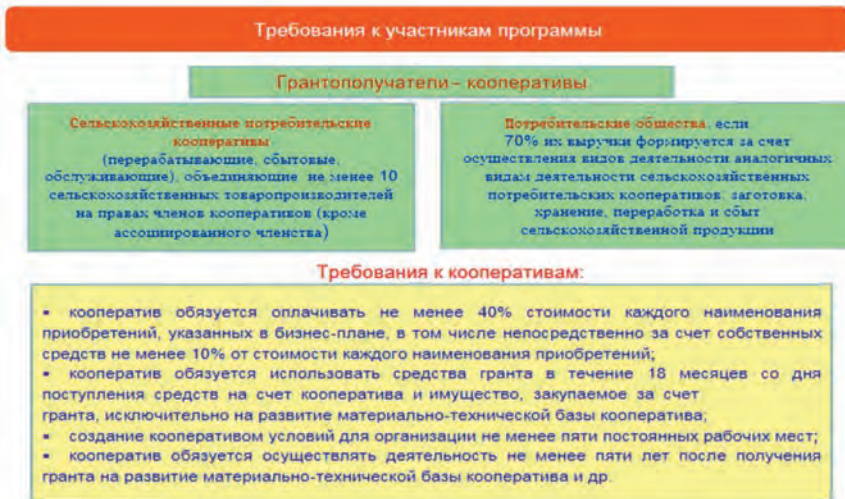
Рис. 5. Требования к участникам программы в 2015-2018 гг.

В 2019 г. в рамках майских указов Президента Российской Федерации принят и реализуется федеральный проект «Создание системы поддержки фермеров и развитие сельской кооперации», главной целью которого стало создание на сельских территориях новых К(Ф)Х и постоянных рабочих мест в них. В действующем механизме господдержки МФХ в рамках федерального проекта были в значительной мере устранены недостатки, выявленные в исследованиях и на практике. Это способствовало расширению членской базы СПоК на 14 тыс. [31].