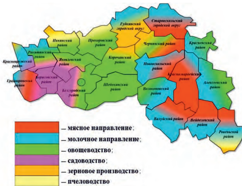
Рис.7. Направления специализации аграрного сектора в районах Белгородской области

ного производства, наличия трудовых ресурсов, перерабатывающих предприятий, инфраструктуры, емкости рынка по конкретной продукции (рис. 7), утвержден План развития кооперативов до 2020 г.