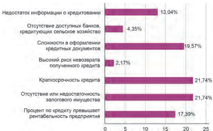
Рис. 3. Основные проблемы, с которыми сталкивались фермеры при получении кредитов [23]

В исследованиях [22, 23] выявлены основные проблемы, с которыми сталкиваются МФХ при получении льготных кредитов (рис. 3).