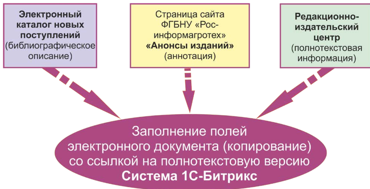
Рисунок 1 - Схема использования данных для актуализации электронной библиотеки ФГБНУ «Росинформагротех»

Формирования метаданных ЭБ осуществляется посредством ввода новых или импортирования имеющихся данных из электронного каталога и сайта ФГБНУ «Росинформагротех» с указанием ссылки на полнотекстовый файл документа (рисунок 1).