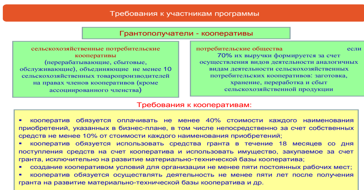
Рисунок 2 - Требования к участникам программы

Порядок и условия предоставления субсидий из федерального бюджета бюджетам субъектов Российской Федерации на реализацию мероприятия по предоставлению грантовой поддержки сельскохозяйственных потребительских кооперативов для развития материально-технической базы в 2015-2016 гг. были утверждены постановлением Правительства Российской Федерации