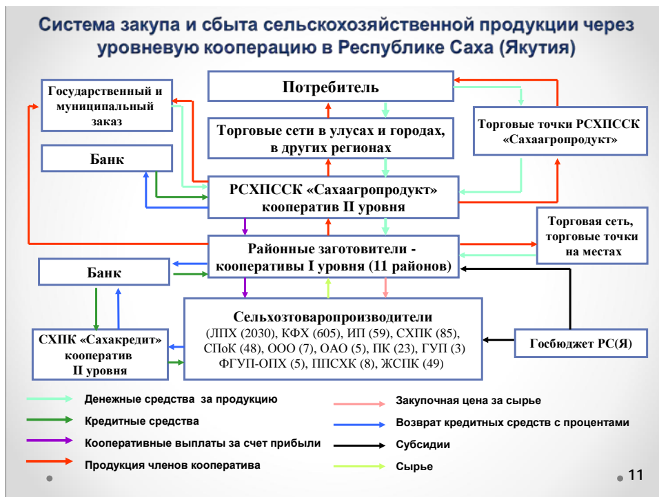
Рисунок 3 - Система закупа и сбыта продукции через кооперацию

Республиканские кооперативы выполняют функции по заготовке, переработке и сбыту сельскохозяйственной продукции. Районные кооперативы первого уровня (12 СПоК) обслуживают 3849 субъектов МФХ. Они реализуют задачу по созданию бренда местного производства. Система закупа и сбыта продукции через многоуровневую кооперацию дана на рис.3.