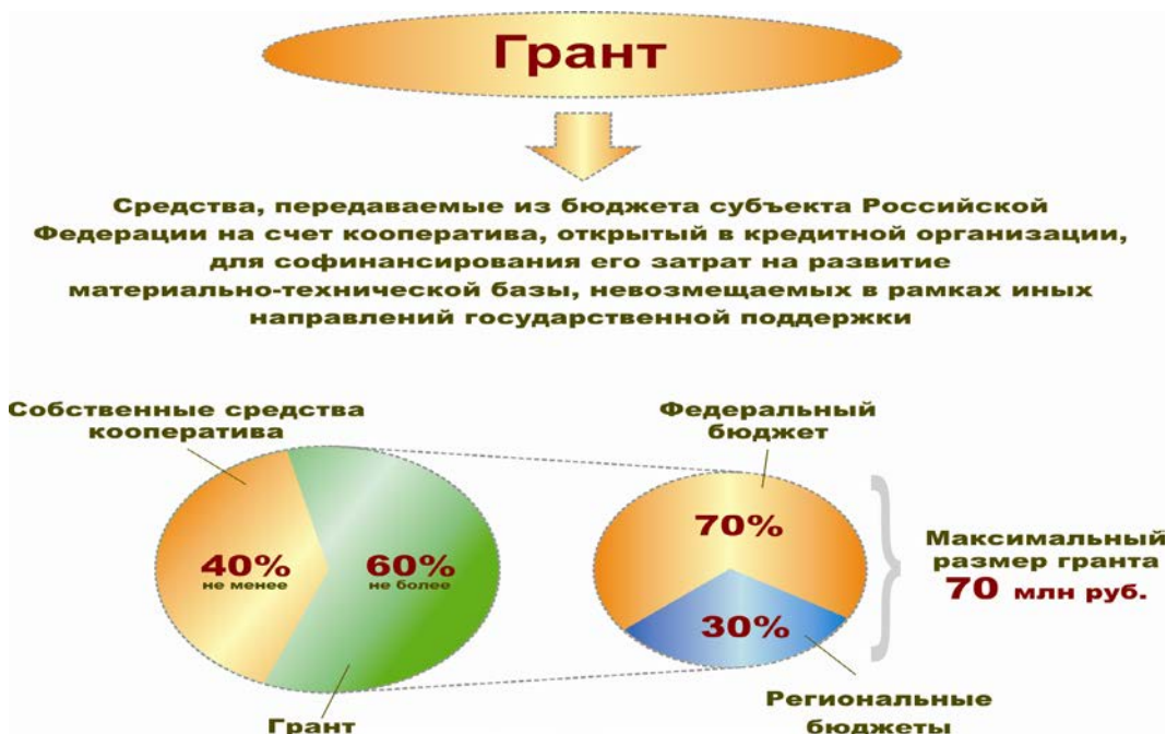
Рисунок 1- Схема грантовой поддержки сельскохозяйственных потребительских кооперативов